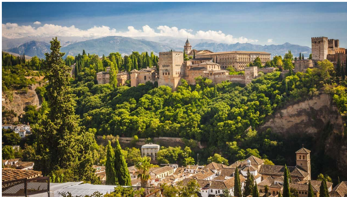
Vista general de La Alhambra

Granada (Ayuntamiento): Creación de una oferta ecoturística más amplia basada en los recursos de su propio espacio rural, de sus núcleos de población y de los municipios colindantes, persiguiendo con ello la desconcentración de la demanda en el centro histórico y favoreciendo la cohesión territorial y la conectividad turística entre centro, barrios, espacios periurbanos y ámbito rural.