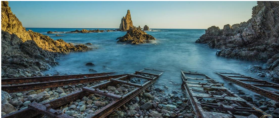
Arrecife Sirenas en Cabo de Gata

Níjar (Ayuntamiento): En la comarca de Níjar se encuentra el parque natural de Cabo de Gata-Níjar, reconocido como Geoparque por la Unesco en 1999. Buena parte del término municipal está incluido en el mismo. Níjar es el municipio de la provincia de Almería con un mayor número de playas y calas a lo largo de sus 63 kilómetros de costa. Objetivo principal: Convertir a Níjar en un destino de referencia internacional del turismo sostenible e inteligente, con un portfolio turístico variado y diverso, en el que el ecoturismo sea su principal eje de desarrollo.