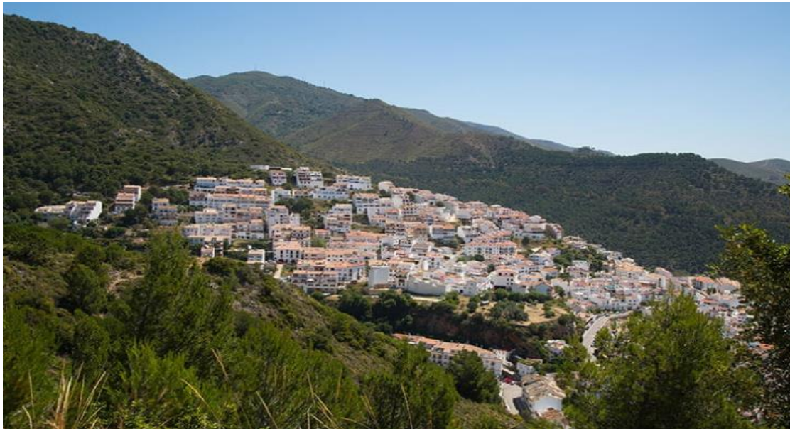
Población de Ojén. Sierra de las Nieves

Sierra de Las Nieves (Mancomunidad): El ámbito de actuación corresponde con 14 municipios del interior de la provincia de Málaga: Alozaina, Benahavís, Casarabonela, El Burgo, Guaro, Igualeja, Istán, Monda, Ojén, Parauta, Ronda, Serrato, Tolox y Yunquera, que se configuran como Área de Influencia Socioeconómica (AIS) del Parque Nacional de la Sierra de las Nieves. El objetivo general es convertir la Sierra de las Nieves en destino turístico sostenible en base a su extraordinario patrimonio natural y la trascendencia y repercusión que otorga su declaración como Parque Nacional.