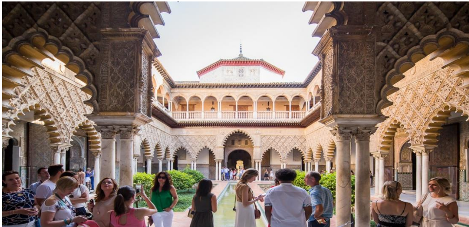
Patio de las Doncellas. Real Alcázar de Sevilla

Sevilla (Ayuntamiento): La ciudad de Sevilla es uno de los grandes referentes del turismo en España. Su centro histórico, y más concretamente el Espacio Central del destino, se constituye en el principal escenario turístico de la ciudad y, por tanto, el que recibe una mayor afluencia turística. En el marco del presente Plan se pretende actuar en aquellos espacios de máxima aglomeración turística, caracterizados por una configuración urbana de calles estrechas en la que la actividad turística convive con la población local. El objetivo general del Plan es convertir a Sevilla en un laboratorio de sostenibilidad e inteligencia turística de centros históricos de turismo urbano, generando conocimiento y diseñando herramientas transferibles.