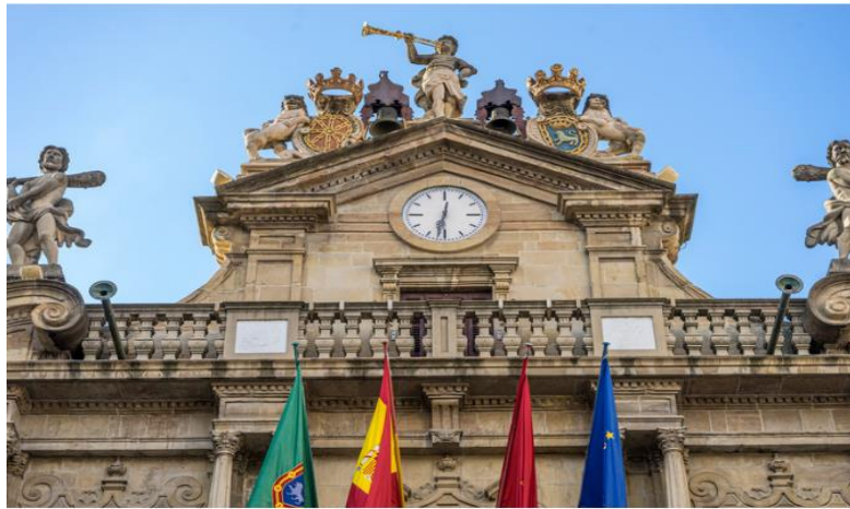
Ayuntamiento de Pamplona

Pamplona (Ayuntamiento): Desarrollar un modelo turístico de ciudad basado en la sostenibilidad medioambiental, socioeconómica y territorial que extienda los beneficios del turismo a la sociedad.