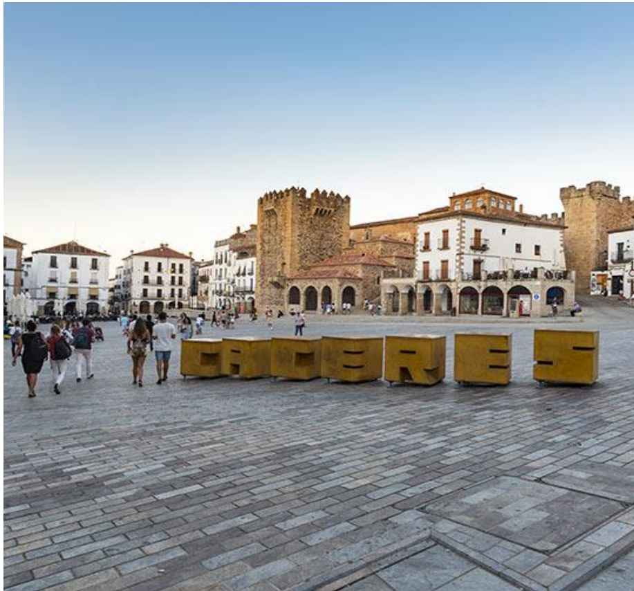
Plaza Mayor de Cáceres

Cáceres (Ayuntamiento): Convertir a la ciudad de Cáceres en una “capital verde y de las culturas”, referente por su apuesta por las nuevas tecnologías y la sostenibilidad: policéntrica, diversa y generosa con su entorno.