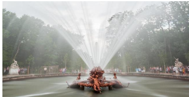
Jardines del Palacio Real de La Granja San Ildefonso

Real Sitio de San Ildefonso (Ayuntamiento): Impulsar un crecimiento inteligente del Real Sitio de San Ildefonso como destino turístico sostenible, con una gobernanza integral y digitalización de productos para lograr un destino más competitivo.