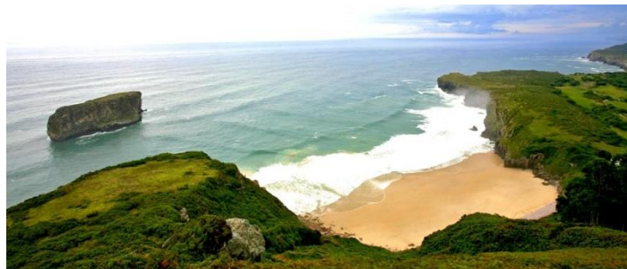
Playa de Ballona. Llanes

Llanes (Ayuntamiento): Cierre del campo Municipal de Golf para evitar daños de la fauna cinegética, mejoras en rutas, adquisición de vehículos eléctricos para aumentar la productividad de los empleados dedicados al mantenimiento de parques, jardines y playas e instalación de puntos de recarga para bicicletas eléctricas.