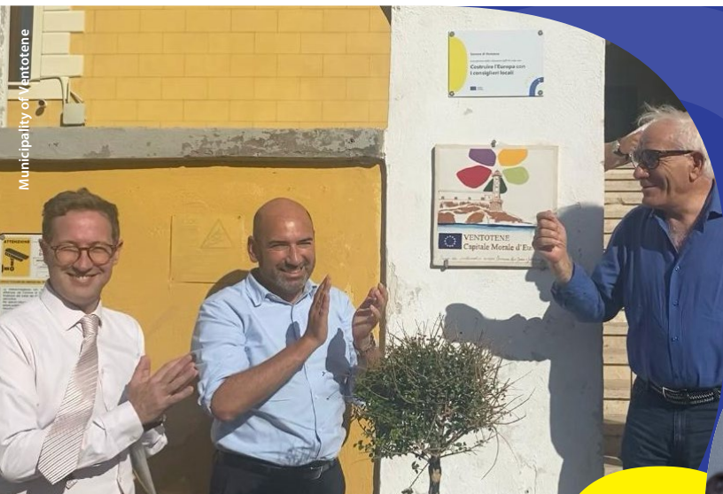
Municipality of Ventotene