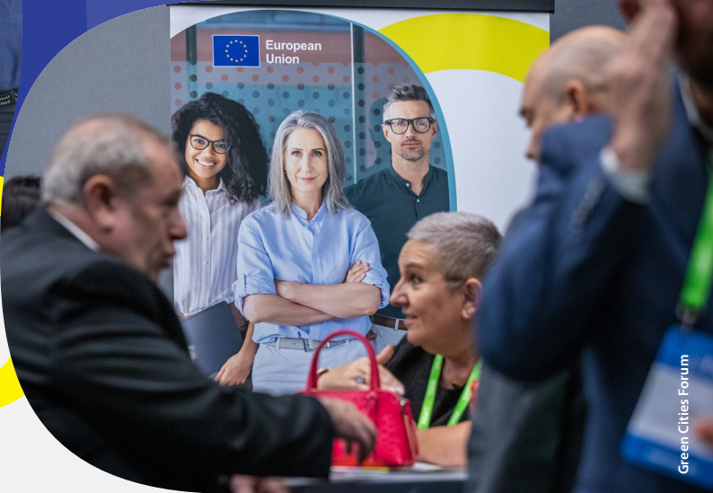
Green Cities Forum

El evento de 2023 marcó un hito significativo para la red BELC: su primera colaboración concreta con su homólogo y red hermana, la "Red de Corresponsales de la UE" gestionada por el Comité de las Regiones. En un taller específico, los miembros